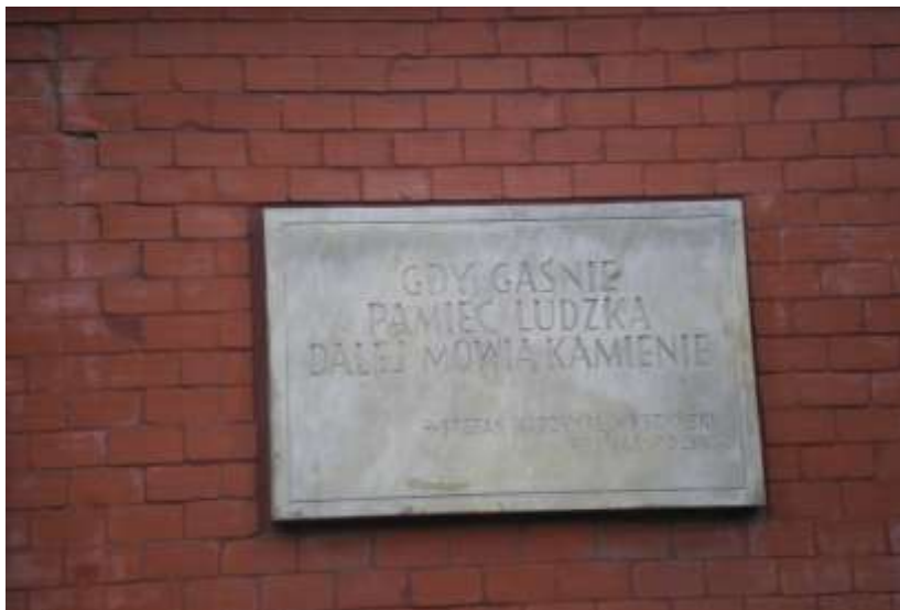
Płyta nagrobna Wisławy Szymborskiej

GDY GAŚNIE PAMIĘĆ LUDZKA DALEJ MÓWIĄ KAMIENIE