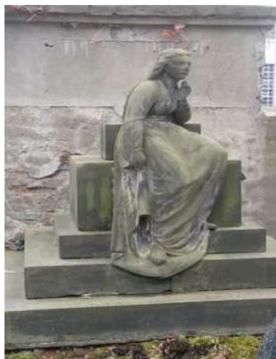
Nie jest znana pochowana osoba Proj. nieznan

Niech świadczy o tym fakt, że grób na którym wyryto w spoczywających snem wiecznym, był uczestnikiem wydarzeń dziejowych danego narodu.