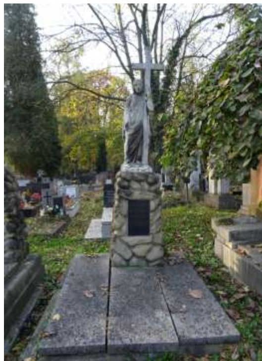
Grobowiec rodziny Woźniakowskich proj. Tadeusz Błotnicki