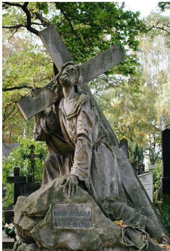
Nagrobek rodziny Światopełk-Zawadzki proj. Teodor Skonieczny 1893r