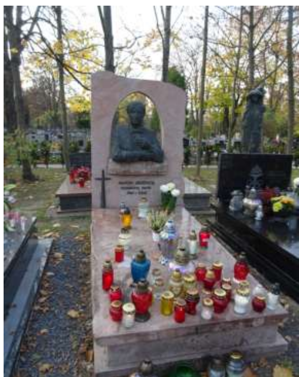
Nagrobek Marka Grechuty proj. Wit Pochurski