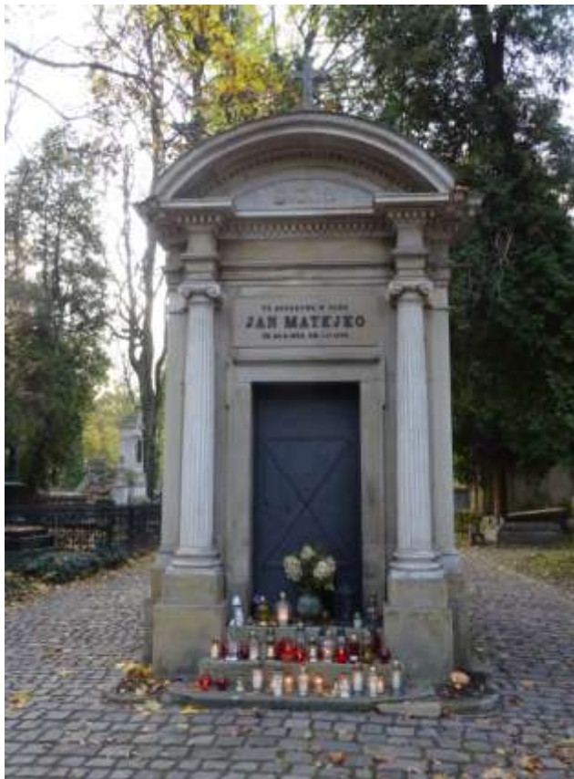
Grobowiec Jana Matejki lecz nie jest miejscem pochówku. Projektant grobowca nieznan