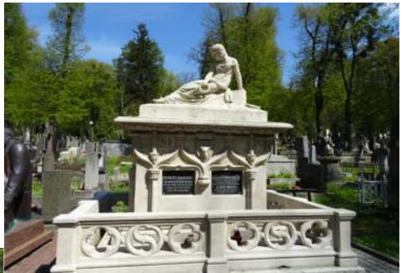
Pomnik Honoraty Borzęckiej dłuta Cypriana Godebskiego Pierwszy pomnik nagrobny wykonany przez Godebskiego