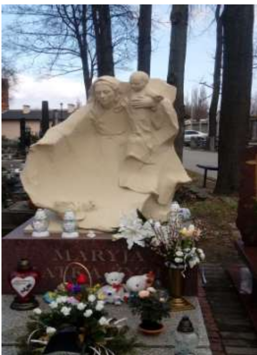
Nie jest znana pochowana osoba Proj. nieznan

Warto w mojej ocenie czytać epitafia i napisy na grobach, bo to fantastyczna skarbnica wiedzy w dawnych zawodach i hierarchii społecznej. Dowiemy się z nich także tego, jak ważne dla podtrzymania kultury były zrywy niepodległościowe.