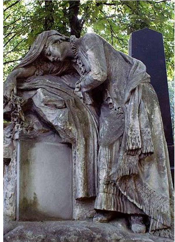
Nagrobek rodziny Krajewskich proj. Teodor Skonieczny 1899r