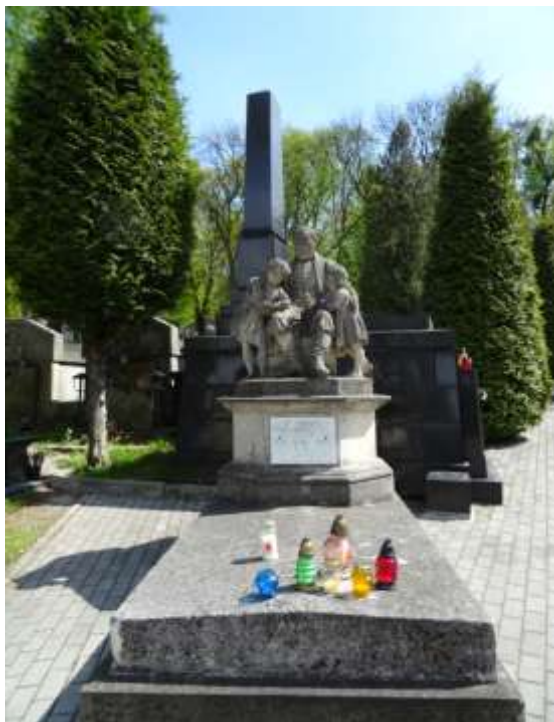
Pomnik Józefa Torosiewicza dłuta Edmunda Jaskólskiego