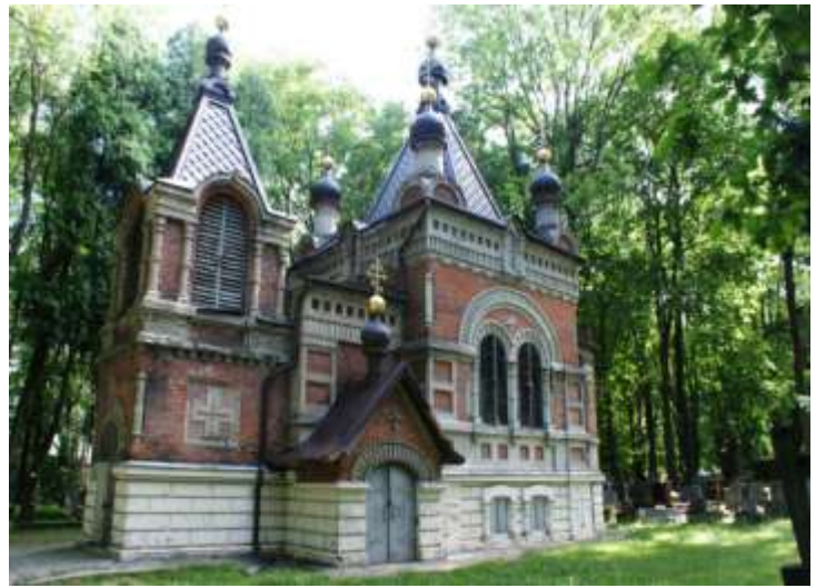
Cerkiew jako kaplica cmentarna na cmentarzu prawosławnym Lublin