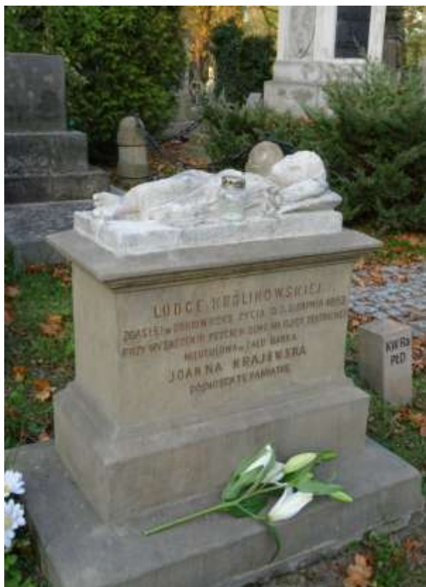
Nagrobek Ludce Królikowskiej i Joanny Krajewskiej proj. Bartłomiej Mazurek