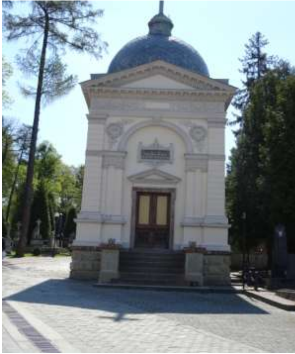
Mauzoleum Baczewskich wzniesione 1883 roku. Twórca nieznany wg projektu lwowskiego architekta Jana Schulza.