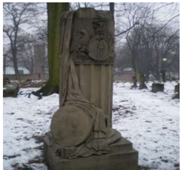
Nagrobek nieznanej pochowanej osoby Proj. nieznanym