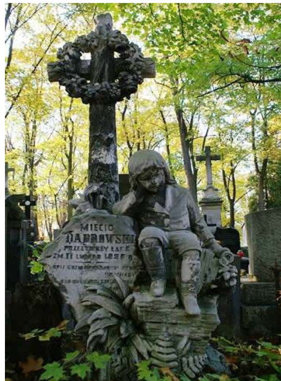
Nagrobek Miecicia Dąbrowskiego proj. Bartłomiej Mazurek 1896 r