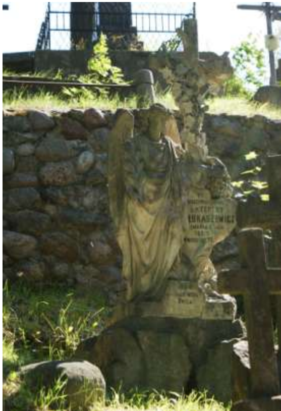
Nagrobek Teresy Łukasiewicz proj. Wojciech Jastrzębski z 1903r