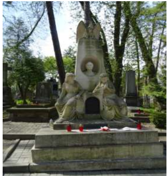
Pomnik Karola Szajnochy z 1868 roku dłuta Parysa Filippiego i Abła Marii Periera