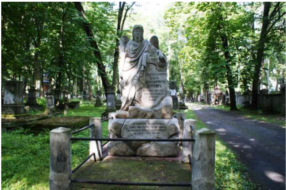
Nagrobek Aleksandrowicza Surkowa proj. wzorowany na pracach Antoniego Kurzawy