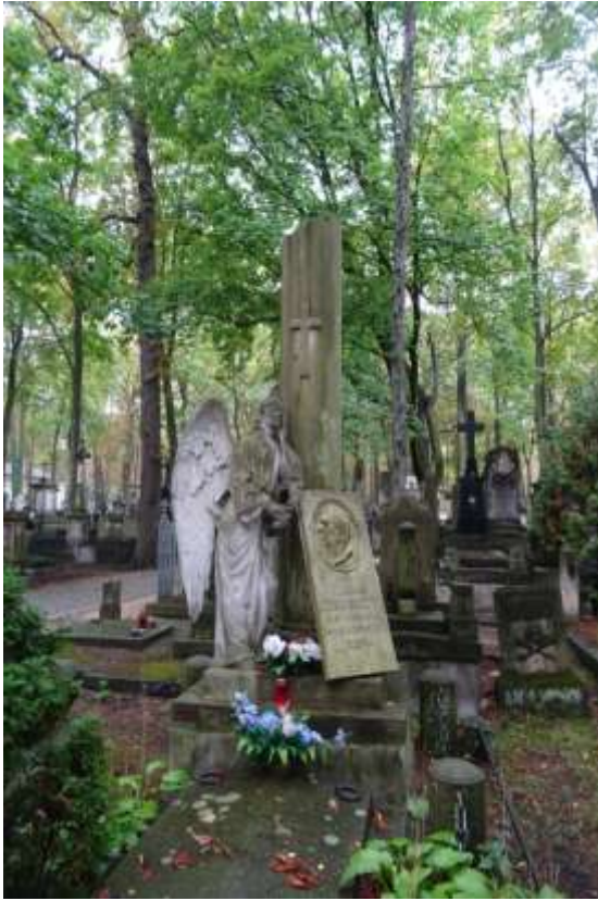
Nagrobek Żółkowskich ojciec i syn wg pomysłu Ludwika Pyrowicza