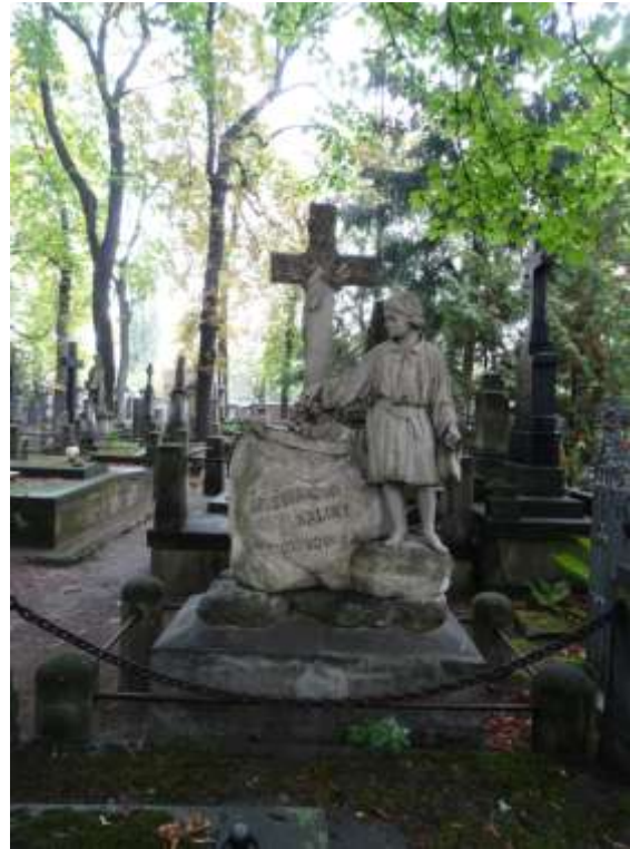
Ignacy Marcel Komorowski kompozytor Rzeźba autorstwa Wojciecha Święckiego 1859