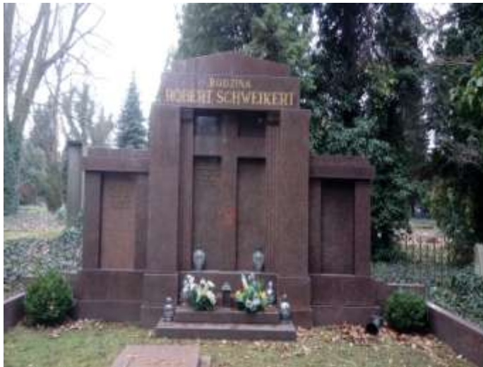
Grobowiec rodziny Roberta Schweikert proj. współczesny architekt