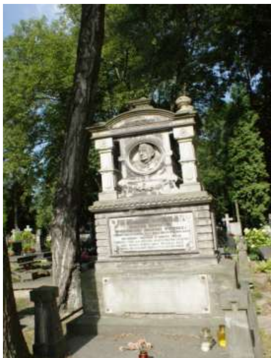
Nagrobek Tomasza Żylińskiego z 1892 r proj. Antonio Argentiego