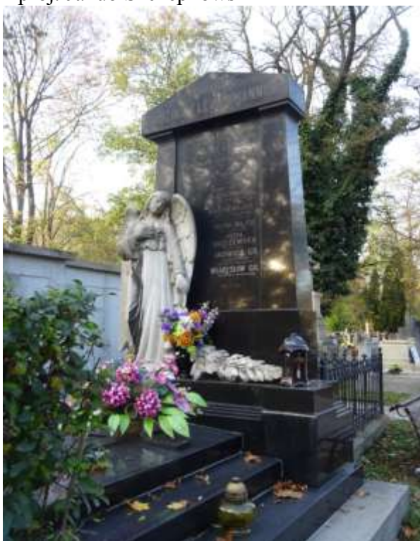
Nagrobek rodziny Fleischmannów proj. Jakuba Szczepkowskiego